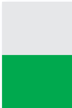
1/2 Seite quer

1/2 Seite quer (ca. 324 x 243 mm) € 1.630,-